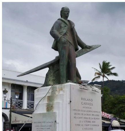
Standbeeld Roland Garros in Saint-Denis op Réunion