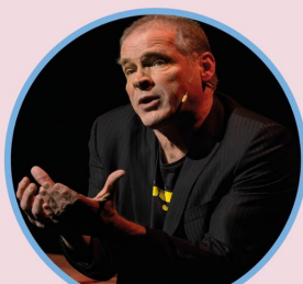
Erik van Muiswinkel