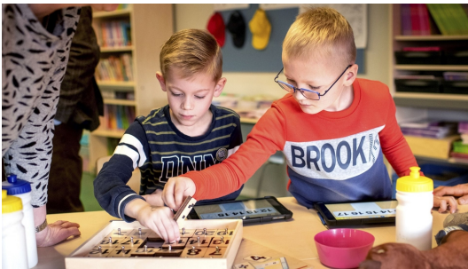
Bern leare Frysk op skoalle (ANP)