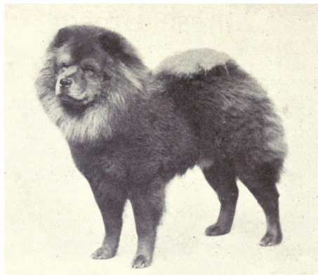
Chowchow in 1915