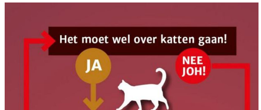
Naar de kieswijzer voor Japanse romans.