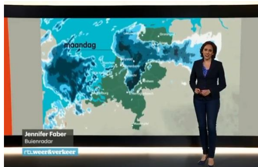
Zegt deze weervrouw 'bui-jen' of 'bui-wen'?

Bij luier blijkt die tussenklank minder duidelijk te zijn, zoals je kunt horen in dit filmpje . Sommige mensen zeggen 'lui- jer ' en andere mensen zeggen 'lui- wer '. Dat gebeurt ook bij buien : sommige weermannen voegen daar een j in en andere een w . Hoe zit dat in elkaar?