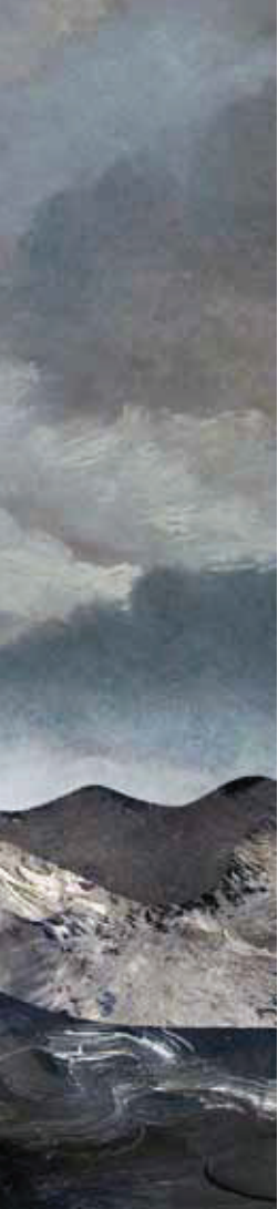
Illustratie: Mattheüs Sluiter

State of the Union is de eindverantwoordelijke voor de tekst niet dezelfde als de spreker: alleen de premier kan politiek afgerekend worden op de Troonrede, niet de vorst dus.