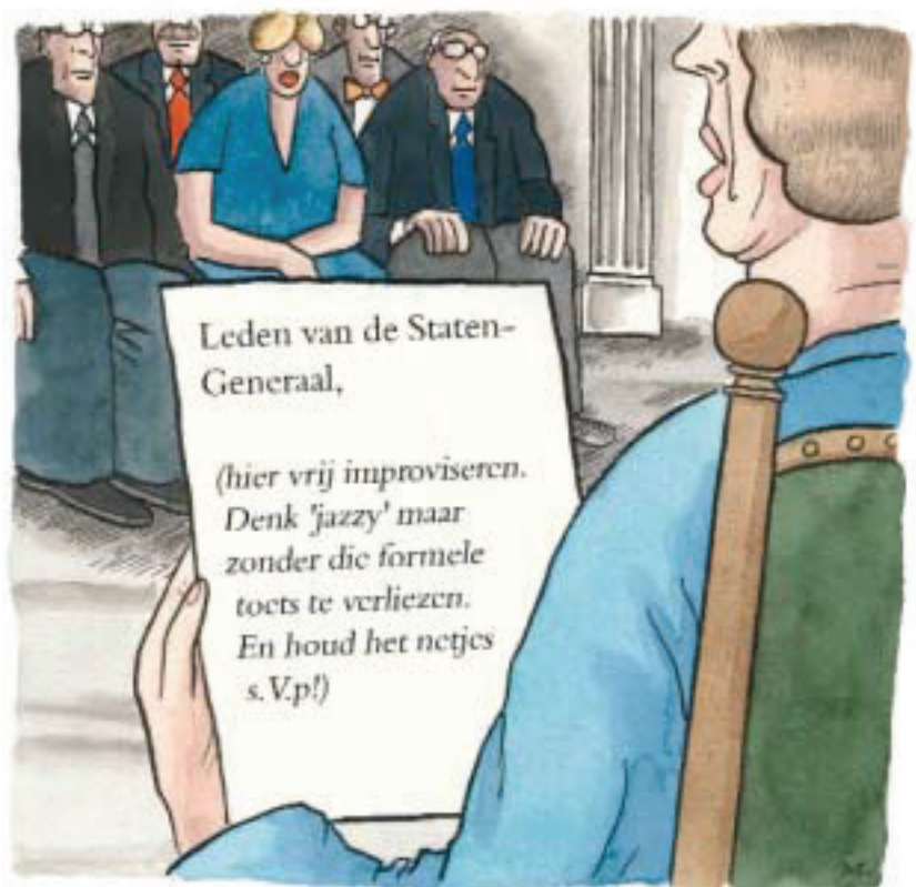
Wat er werkelijk in de Troonrede staat

In de afgelopen jaren leken wij in de Nederlandse