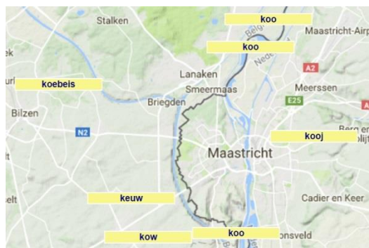
Koe in verschillende dialecten.

Je kunt bijvoorbeeld wonen in Tilburg en werken in Den Haag. Als je in Den Haag met collega's spreekt die uit verschillende woonplaatsen komen, zul je minder geneigd zijn dialect te gebruiken. Iedereen zal algemeen Nederlands met elkaar praten. Ook als je met iemand gaat samenwonen die uit een andere streek komt, zul je dialect vermijden en de voorkeur geven aan de standaardtaal die in het hele land wordt gesproken.