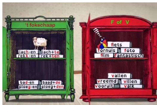
Taalregels leren met liedjes.