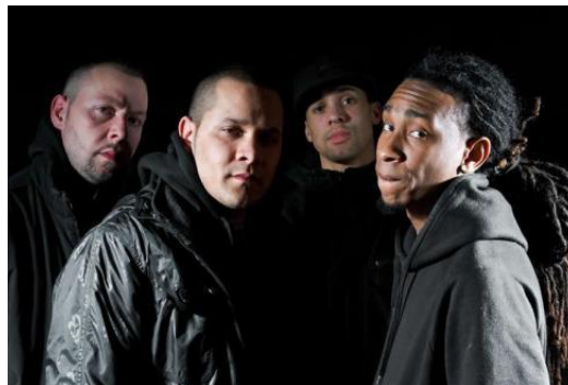
Rapgroep Zo Moeilijk.

Het resultaat? Sommige hiphopartiesten hebben een even rijke woordenschat als bekende schrijvers. Bij populairdere artiesten ligt het aantal unieke woorden lager.