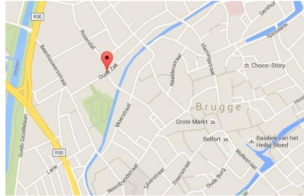
Oude Zak: de gekste straatnaam van Vlaanderen

Een Nederlandse bewoner van de Oude Zak is best tevreden met de naam van de straat. Vooral Nederlandse toeristen vinden de dubbele bodem van de straatnaam leuk. Er wordt weleens gegrapt dat je alleen in de Oude Zak kunt wonen als je een oude zak bent.