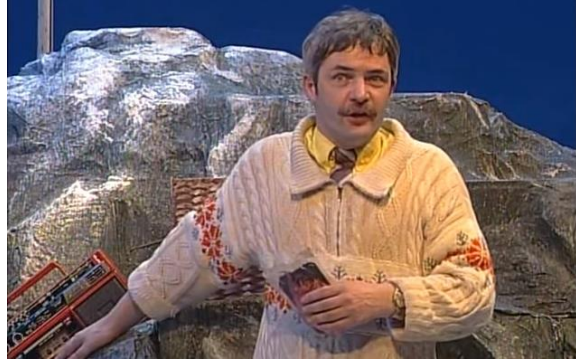
Dialectcabaret van Herman Finkers.

Ondertussen is dat minderwaardigheidsgevoel wel verdwenen. Veel dialectsprekers zijn trots op hun dialect, en daarom doen ze er alles aan om het te behouden. Zo zijn er zangers en cabaretiers die in de taal van hun eigen streek zingen en grappen maken.