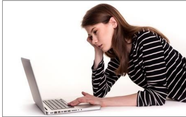
Erger jij je aan taalfouten in e-mails?

Uit de reacties bleek dat introverte (= 'naar binnen gekeerde') lezers zich sneller ergerden aan de mails met taalfouten dan lezers met een extravert (= 'op de buitenwereld gericht') karakter. Introverte mensen zijn dus gevoeliger voor taalfoutjes .