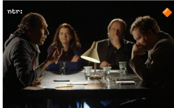
Het experiment van de Nijmeegse wetenschappers.

Het enige verschil was: de ene man sprak met een duidelijk herkenbaar Marokkaans accent, en de ander had een Amsterdams accent. Je kunt het filmpje hier bekijken. Wat gebeurde er? De man met het Amsterdamse accent werd meteen geholpen, en de man met het Marokkaanse accent niet.