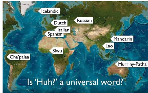
Een paar talen waarin huh? voorkomt.

De Ig Nobel-prijzen zijn bedoeld voor 'onderzoek dat je eerst aan het lachen maakt, en vervolgens aan het denken zet'. Dit jaar is een van de prijzen gewonnen door drie Nijmeegse taalwetenschappers, die ontdekten dat mensen van alle volken huh (of hè of iets anders wat daarop lijkt) gebruiken als ze niet goed snappen wat de ander zegt. Om de uitkomst van hun onderzoek zul je inderdaad eerst (glim)lachen. Kijk maar eens naar dit filmpje waarin je ziet hoe huh? over de hele wereld klinkt.