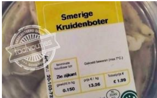
Een bijzondere soort kruidenboter ...

En wat dacht je van een product dat je in de winkel koopt met daarop het etiket “Smerige Kruidenboter”?