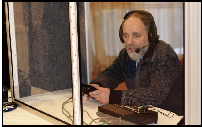
Een congresstolk aan het werk.

Congresstolken hebben het over A-, B- en C-talen. A-taal staat voor hun moedertaal, B beheersen ze goed, en C is een taal die ze wel begrijpen, maar waarin ze niet kunnen tolken. De kunst van hun vak is om op het juiste moment de juiste vertaling te geven. Dat is niet altijd even gemakkelijk en je hebt er veel zelfvertrouwen voor nodig.