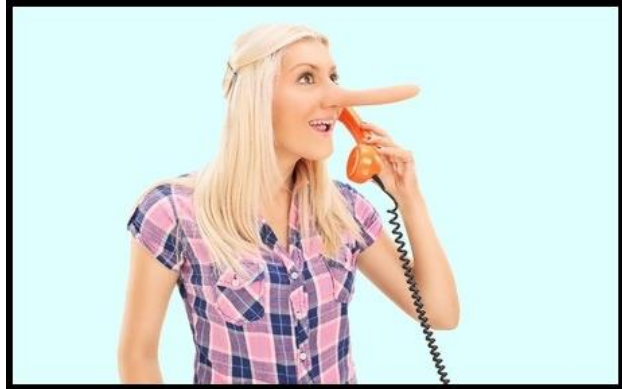
'Er was hier geen feestje.'

Er zijn vier dingen waar je dan op moet letten. Ten eerste gebruiken leugenaars niet vaak het woord ik : ze zeggen niet 'Ik heb geen feestje gegeven', maar 'Er was hier geen feestje'. Zo proberen ze afstand te nemen van wat ze beweren. En ten tweede, als iemand iets eenvoudig uitlegt, let dan ook goed op: leugentjes zijn vaak eenvoudig, want dat kost minder moeite dan een ingewikkelde smoes. Ten derde gebruiken liegebeesten voor die simpele smoesjes dan weer wel heel lange zinnen, omdat ze allerlei overbodige woorden en details toevoegen. En ten slotte gebruiken ze veel woorden die een negatieve lading hebben, omdat ze onbewust toch een vervelend gevoel over zichzelf hebben.