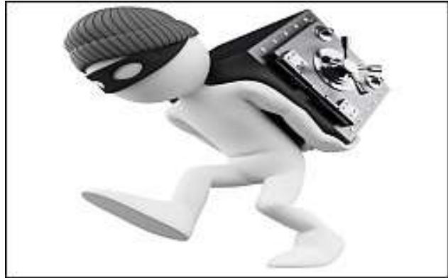
Soms gebruiken dieven codetaal.

Is het je weleens opgevallen dat er in heel veel groepen codetaal gebruikt wordt? Ook gezinnen gebruiken vaak woorden of uitdrukkingen die buitenstaanders niet begrijpen. Bij jou thuis is dat vast ook zo.