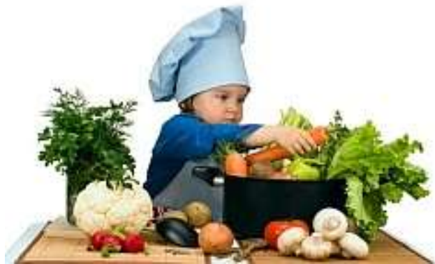
Talen leren in de keuken.

Volgens de onderzoekers leer je een taal makkelijker als je een opdracht moet uitvoeren in die taal. Dat brengt de taal tot leven, je bent er meer bij betrokken en je steekt er ook nog wat van op.