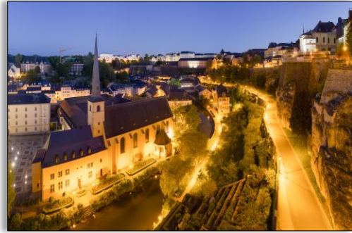
Luxemburg bij nacht..

Maar er bestaat ook zoiets als het Luxemburgs, dat het Lëtzebuergesch genoemd wordt. Het was oorspronkelijk een Duits dialect, dat in 1984 uitgeroepen werd tot 'nationale taal'. Toch spreken maar 250.000 van de 550.000 inwoners het Lëtzebuergesch. Daarom vinden lang niet alle Luxemburgers het terecht dat het Lëtzebuergisch een nationale taal genoemd wordt. Maar er zijn ook mensen die juist vinden dat alle Luxemburgers deze 'eigen' taal moeten kunnen spreken. Zij willen er zelfs een officiële taal van maken.