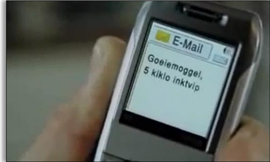
Uit het goeiemoggel -filmje van KPN

Goeiemoggel was voor het eerst te horen in een reclamefilmje voor KPN , bijna tien jaar geleden. De makers bedachten dat ze iets grappigs konden maken door tikfouten uit te spreken. Zo ontstonden goeiemoggel , transploft , ordrekverwerking en 5 kiklo inktvip .