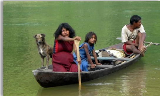
Veel talen hebben nog maar weinig sprekers.

Hoe komt het dat zo veel talen uitsterven? Dat komt doordat er veel talen zijn met weinig sprekers. Dat heeft in veel gevallen te maken met de kolonisatie van vroeger. Op het moment dat een land een kolonie werd, voerden de kolonisten hun eigen taal in als belangrijkste taal. Die taal moest worden aangeleerd op scholen en werd bijvoorbeeld gebruikt in de handel en in de rechtspraak. Nog altijd ondervinden inheemse volkeren daar de gevolgen van: hun eigen (‘inheemse’) taal wordt niet officieel erkend en op school moeten ze een andere taal aanleren. Veel mensen leren de inheemse taal daarom niet meer. Daardoor vermindert het gebruik van veel inheemse talen zienderogen.