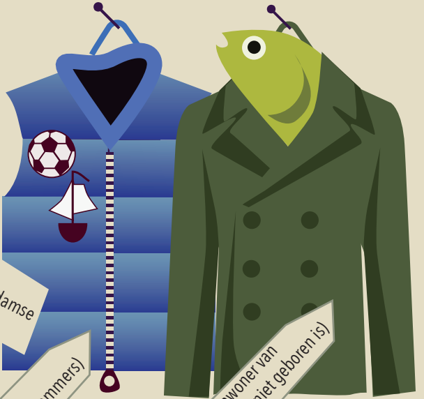
bodywarmer (voor halve Volendamers)