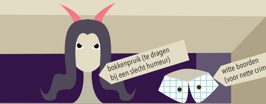
bokkenpruik (te dragen bij een slecht humeur)