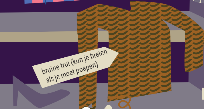
bruine trui (kun je breien als je moet poepen)