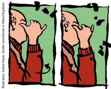
Het gebaar voor ‘Jan Marijnissen’ is hetzelfde als dat voor os , vanwege zijn woonplaats Oss.

“Overigens zijn de journaalteksten de afgelopen jaren wel gemakkelijker geworden om te tolken doordat ze steeds dichter bij de spreektaal blijven. Ook de politici in het journaal zijn merkbaar anders gaan spreken: duidelijker en met minder deftige woorden.”