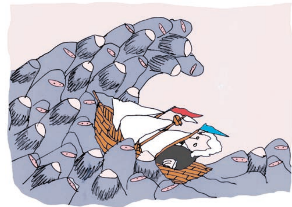
Illustraties: Martijns Sluiter

aanrechtsubsidie Eind juni 2006 valt het derde kabinet-Balkenende. Al snel beginnen de partijen de messen te wettten om bij de verkiezingen op 22 no-