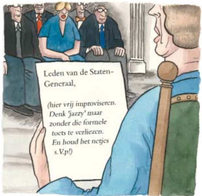
Wat er werkelijk in de Troonrede staat

In de afgelopen jaren leken wij in de Nederlandse